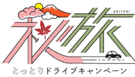
秋旅とっとりドライブキャンペーン