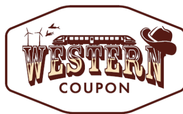
ウエスタンクーポン