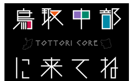
鳥取中部に来てね