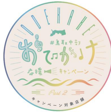
鳥取中部おでかけ応援キャンペーン Part2