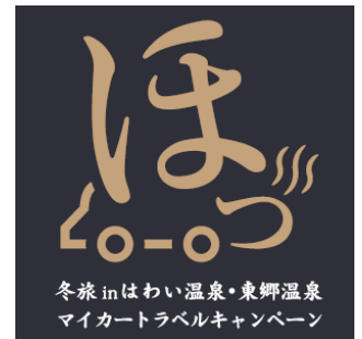
冬旅 in はわい温泉・東郷温泉 マイカーラベルキャンペーン