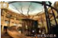
二十世紀梨の日本

日本唯一の梨をテーマとした展示施設。1年中3種類の梨の試食可能なコーナーが好評。(入館料要)