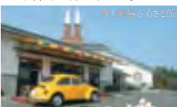
青山剛昌ふるさと館

地元の左官職人が漆喰壁に鏡で描いた浮彫の模様。一集落の集積は日本有数で村全体が美術館の様。個人邸宅内に立ち入る場合は必ず許可を得てください。