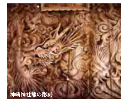
神崎神社龍の彫刻

断崖絶壁に浮かぶように建つ、荘厳で優雅な国宝。日本一危険な国宝とも呼ばれる険しい修験道の道を登り目にする投入堂は感動的！(入山料要)