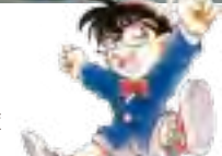
©1994 Goshō AOYAMA / Shogakukan Inc.